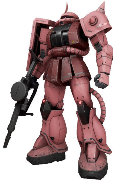
▲ユニットスキン「シャア専用ザク II S」