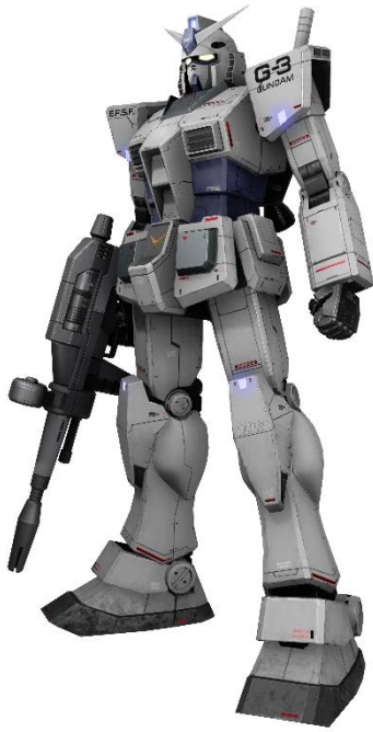
▲ユニットスキン「G-3 ガンダム」