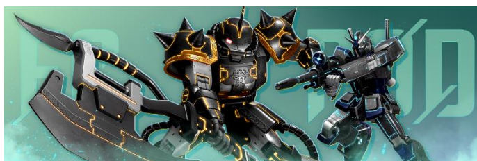
▲SEASON1 LD 2