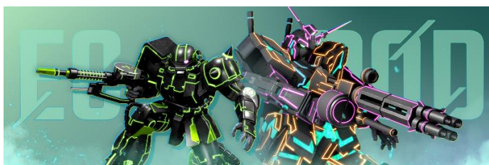
▲SEASON1 LD 1