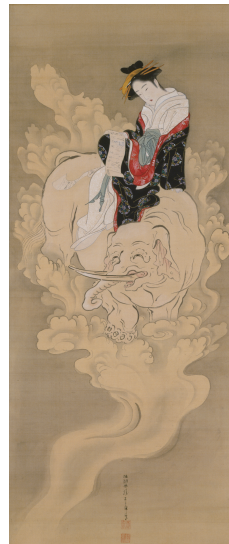
勝川春章《見立江口の君図》 18世紀 個人蔵 通期展示▶