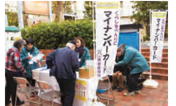
▲12月14~16日笹塚キャンペーン