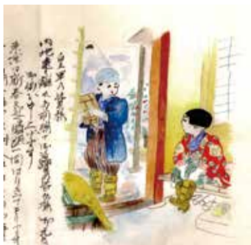
▲戦地へ送られた手紙

回 8月16日(日)まで 内 70年以上前に戦地に送られ、昨年日本に戻ってきた初公開の手紙など戦争関係の資料から、高度経済成長期の玩具まで、懐かしい「昭和」の資料を展示