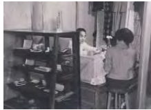
昭和28年頃▶ 恋文横丁「手紙の店」