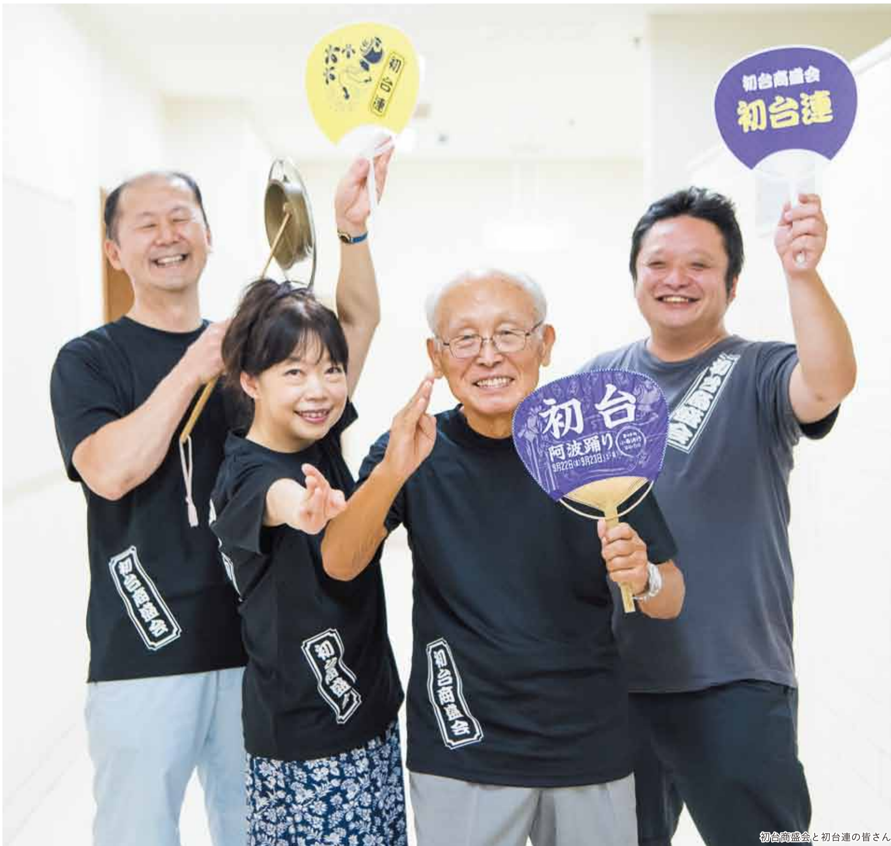
初台商盛会と初台連の皆さん

発行 | 渋谷区 編集 | 広報コミュニケーション課 住所 | 〒150-8010 渋谷1-18-21 電話 | 03-3463-1211 (代表) 公式HP | www.city.shibuya.tokyo.jp/ 公式Twitter | @city_shibuya