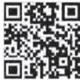
▲モバイルレジダウンロードページ