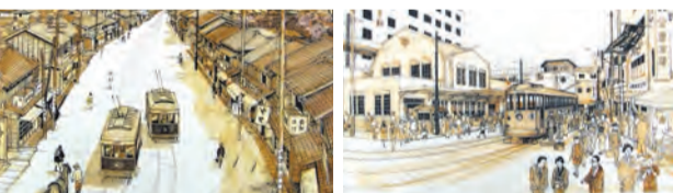
▲大正時代の中通り

▶内容 実体験や聞き取りなどをもとに描かれた渋谷の風景画を、当時の生活資料とともに展示