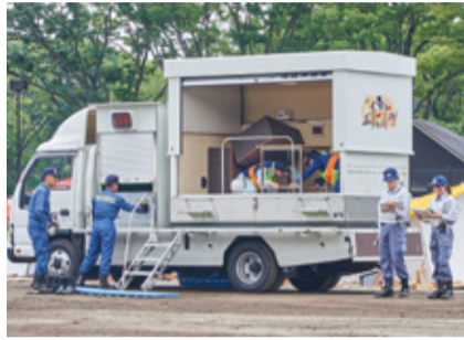
▲地震の揺れを再現