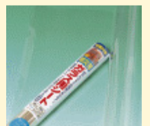
▲ガラス飛散防止フィルム