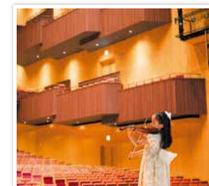
▲LINE CUBE SHIBUYA(渋谷公会堂)