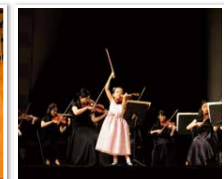
▲(6歳時)初めてオーケストラと共演