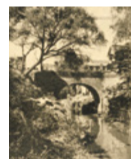
▲昭和初期 恵比寿橋

▶日程 4月20日(土)~6月16日(日) ▶内容 渋谷川の流域を約1世紀隔てた新旧の写真を紹介