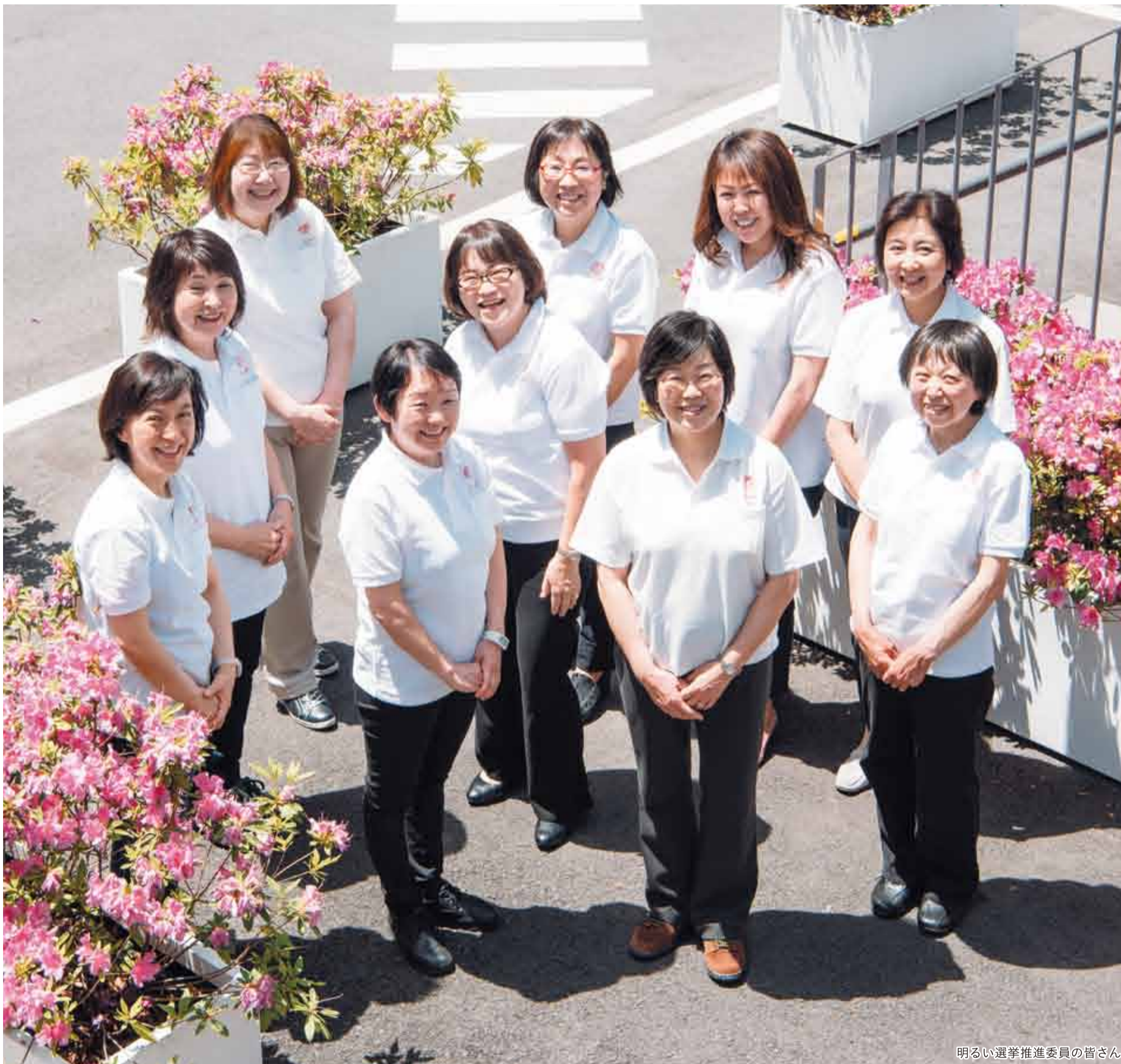
明るい選挙推進委員の皆さん

発行 | 渋谷区 編集 | 広報コミュニケーション課 住所 | 〒150-8010 渋谷1-18-21 電話 | 03-3463-1211 (代表) 公式HP | www.city.shibuya.tokyo.jp/ 公式Twitter | @city_shibuya