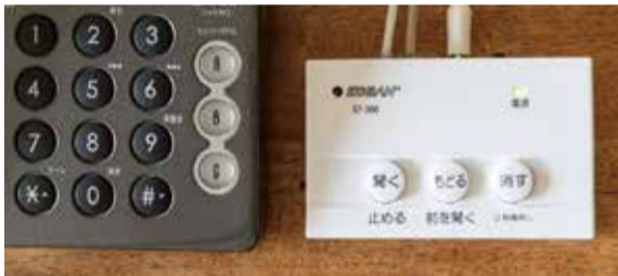
▲自動通話録音機(電話は貸し出していません) ☎安全対策課防犯対策主査 (☎3463-1598 ☎5458-4916)