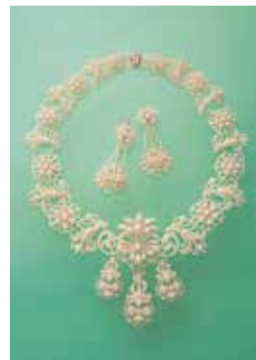
▲《シードパールネックレス&イヤリングセット》 19世紀初期 イギリス 穂葉アンティークジュウリー美術館