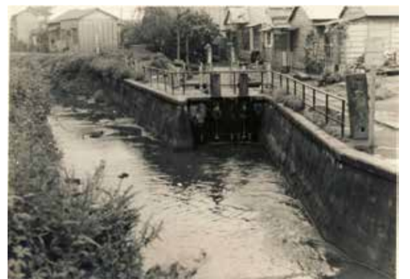
▲昭和30年代 笹塚にあった三田用水取水口

内 暗渠になる前の初台・幡ヶ谷付近や三田用水取水口など、昭和40年代までの玉川上水の写真を紹介