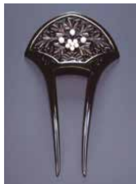
▲《髪飾り「牡丹」》 御木本真珠店か 1925年頃 ミキモト真珠島 真珠博物館

内 古代から近代に英国をはじめとするヨーロッパ各国や日本で制作された真珠の装身具を紹介