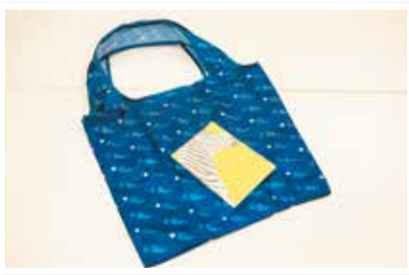
▲東京都薬剤師会が配布する残薬バッグ。各地でオリジナルバッグが配布されています