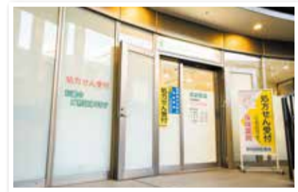
▲渋谷区文化総合センター大和田1階「さくらが丘薬局」