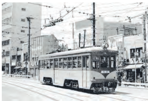
▲昭和40年 道玄坂上を走る玉電