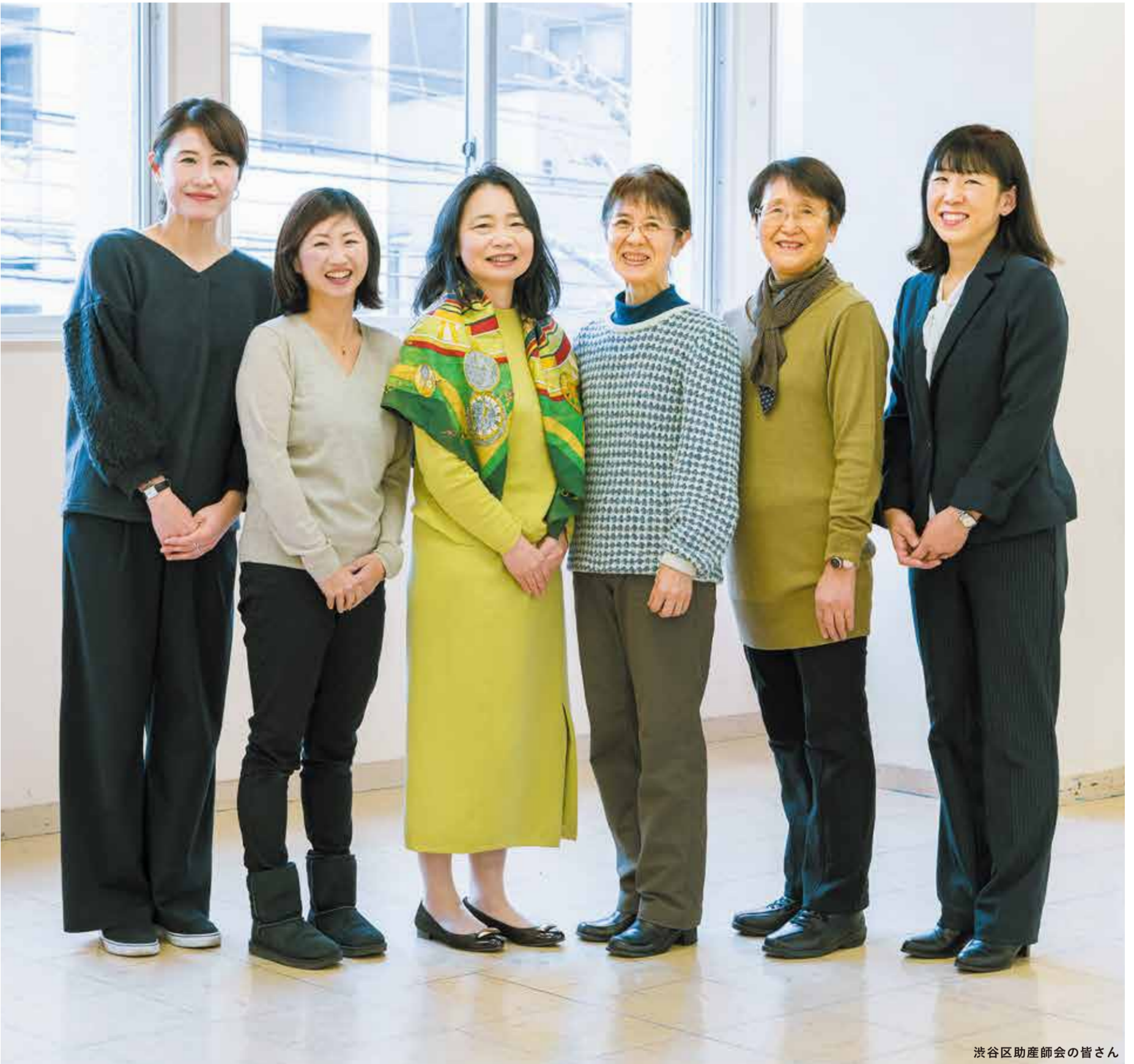
渋谷区助産師会の皆さん

発行 | 渋谷区 編集 | 広報コミュニケーション課 所在地 | 〒150-8010 宇田川町1-1 電話 | 03-3463-1211 (代表) HP | www.city.shibuya.tokyo.jp/ Twitter | @city_shibuya Facebook | @shibuya.city Instagram | city_shibuya_official