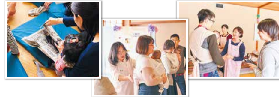
▲ 2月16日に開催された幡ヶ谷社会教育館文化祭での防災講習

問 広報コミュニケーション課 広報係 ☎3463-1287 📠5458-4920