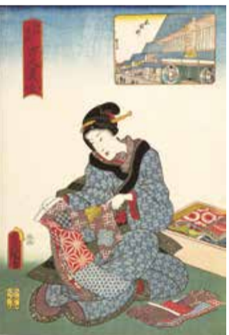
歌川豊国(三代)《江戸名所百人美女 尾張町》1858年 東京都江戸東京博物館(4月6日~5月1日展示)

回5月26日(日)まで ※会期中展示替えあり。 ※高校生を含む18歳未満の人が観られない作品が一部含まれます。