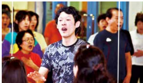
場・間幡ヶ谷社会教育館 (☎3376-1541 ㊟3375-9278)

回6月1~29日の(出)10:00~11:30 内容フィットネスクラブ向けに開発された声の運動 ヴォーカリズム