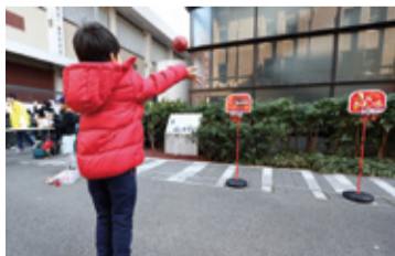
▲渋谷どこでも運動場プロジェクト

区では区全体を「15km 2 の運動場」と捉え、さまざまなスポーツが暮らしに溶け込むようなまちづくりを進めています。この日は大学の敷地内でミニバスケットボールや玉入れを通じて、参加者の交流が図られていました。