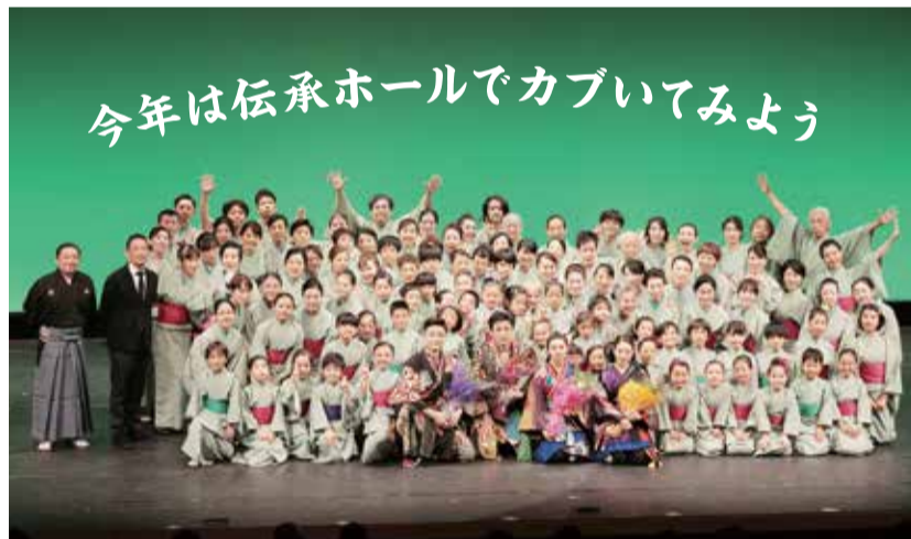
▲令和元年度の公演