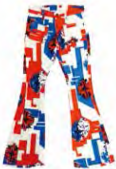
▲ベルボトムパンツ (1960~70年代)

回 3月26日(日)まで 内 戦後以降の昭和の暮らしを、家電・住宅・流行の3つの切り口から紹介 ・ 展示解説 回 2月11日(祝) 14:00から