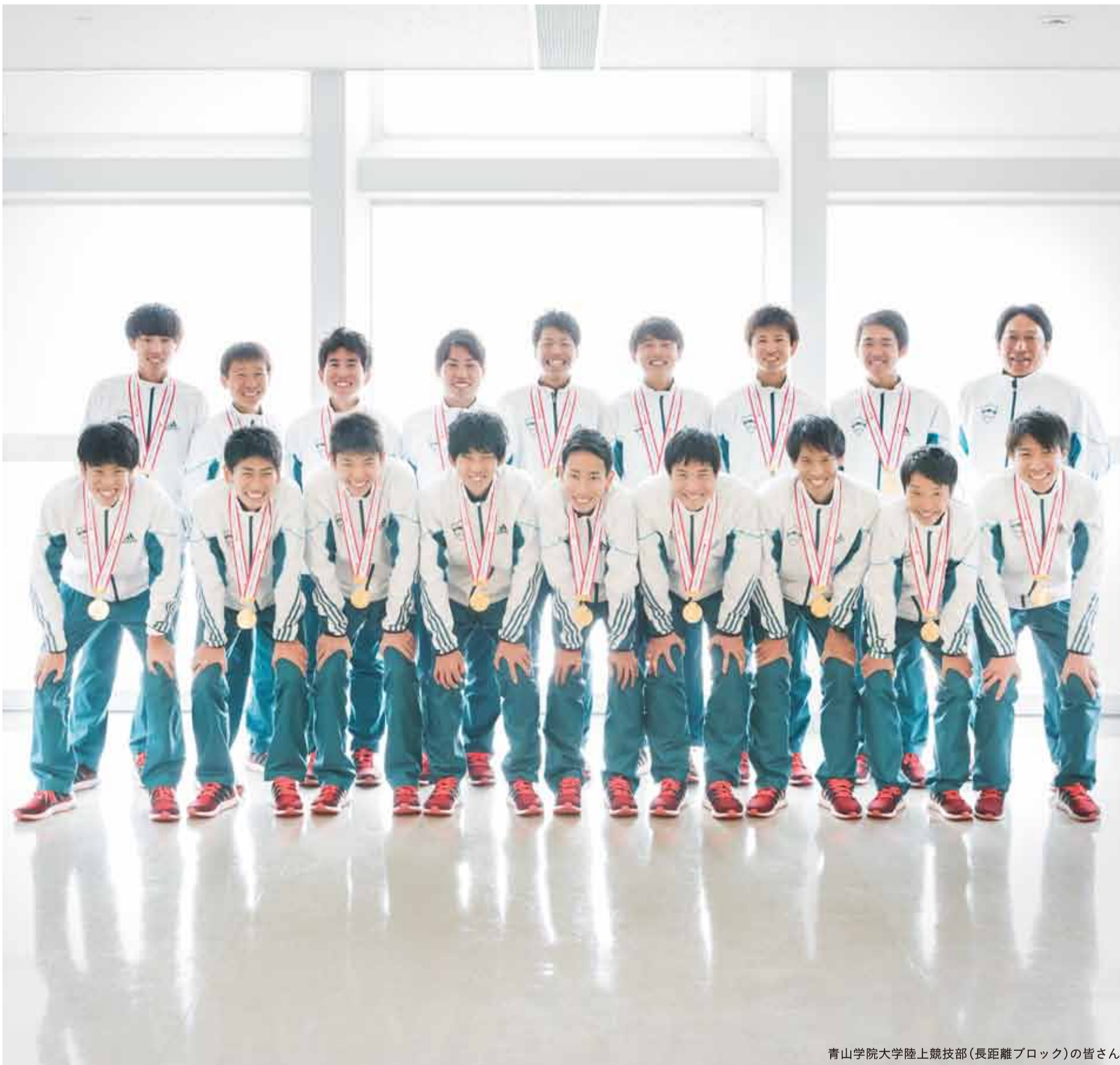
青山学院大学陸上競技部(長距離ブロック)の皆さん

発行 | 渋谷区 編集 | 広報コミュニケーション課 住所 | 〒150-8010 渋谷1-18-21 電話 | 03-3463-1211 (代表) 公式HP | www.city.shibuya.tokyo.jp/ 公式Twitter | @city_shibuya