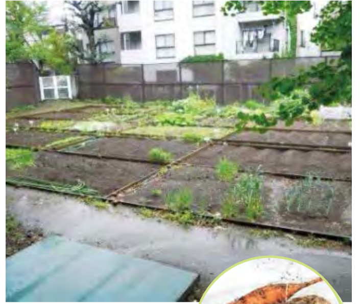
季節によっていろいろな野菜が育てられます