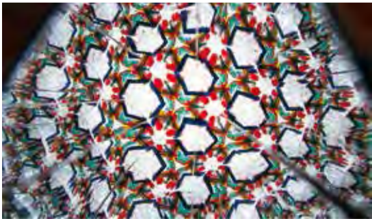
▲ベットボトルやトイレトペーパーの芯などを使った万華鏡づくり

☑ ①・③ 在住・在学の小学生(①は保護者同伴) ② 在住・在学の小学生~高校生 ☑ 2月10日から電話・窓口で