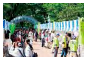
▲各種団体、ボランティア、地域の皆さんでにぎわいます

5月14日に総合ケアコミュニティ・せせらぎで開催するせせらぎまつりで、発表・展示・販売・体験交流などを行う団体を募集します(抽選)。