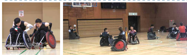
▲東京2020パラリンピックに向けて区内で練習する車いすラグビー選手

開催地である渋谷区での練習が再開し、チームとしても個人としても目標である金メダルを取るためのモチベーションがさらに高くなりました。さらに1年かけて車いすラグビーの普及や金メダルを取るための準備ができるので、時間を大切に過ごしていきたいと思えます。