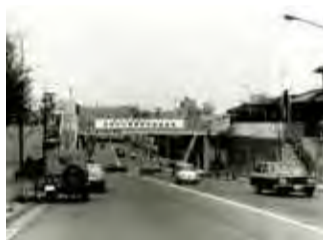
▲(写真イメージ) 1960年代の渋谷の街並み

回(土)・(日)・(祝)を除く11:00~16:00に出張所・区民サービスセンターへ持参 ※写真やアルバムはその場で返却します。 ※詳しくは1964TOKYO VR☎(1964tokyo-vr.org/)をご覧ください。 回地域振興課地域振興係 (☎3463-1656 ☎5458-4906)