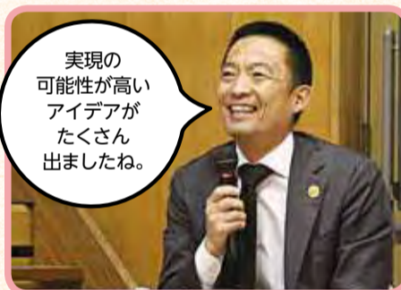
▲各プロジェクトによる発表