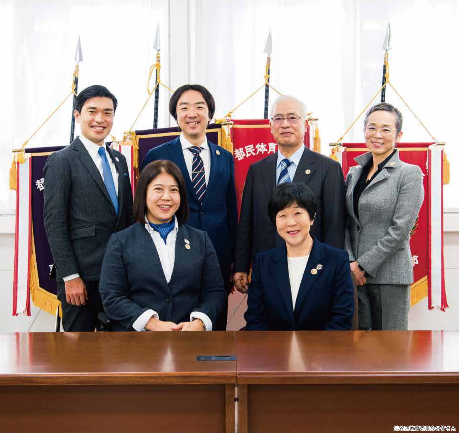
渋谷区教育委員会の皆さん

発行 | 渋谷区 編集 | 広報コミュニケーション課 住所 | 〒150-8010 渋谷1-18-21 電話 | 03-3463-1211 (代表) 公式HP | www.city.shibuya.tokyo.jp/ 公式Twitter | @city_shibuya