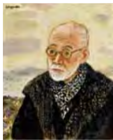
《斎藤茂吉肖像画》鈴木信太郎画、1952(昭和27)年、油彩、斎藤茂吉記念館所蔵