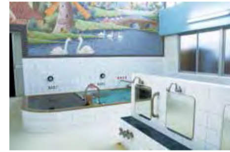
▲広尾湯 区福祉部民生係 (☎3463-1832 ㊟5458-4936)