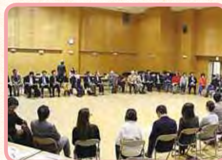
▲最後は輪になって振り返り