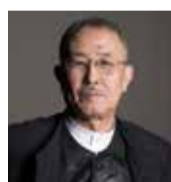
▲山下洋輔

固 文化総合センター大和田ホール事務室 ☎ 03-3464-3252 ☎ 03-3464-3289