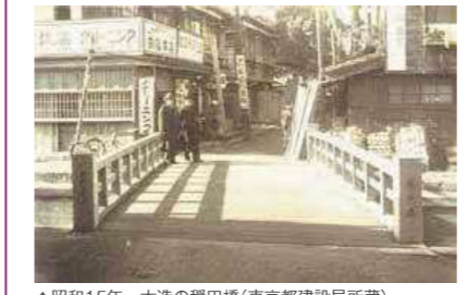
▲昭和15年 木造の總田橋

写真展「渋谷川今昔 一昭和の初めと平成の終わりの風景」 6月16日(日)まで 渋谷川の流域を約1世紀隔てた新旧の写真を紹介