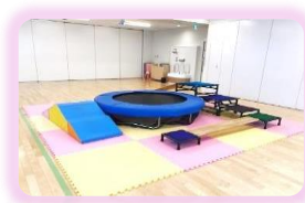
トランポリン・フランクなど