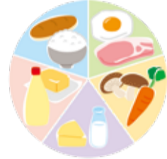
図 中央保健相談所保健管理係 ☎03-3463-2444 ☎03-5458-4944