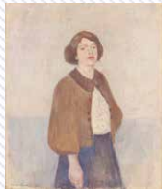
▲南薫造《西洋女性》 1909年 油彩 カンヴァス 渋谷区立松濤美術館所蔵