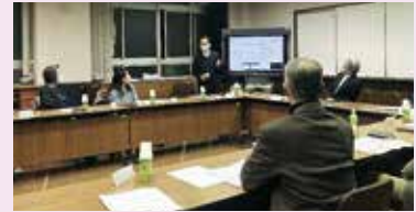
▲学校運営協議会の様子(猿楽小)