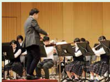
▲渋谷本町学園中学校