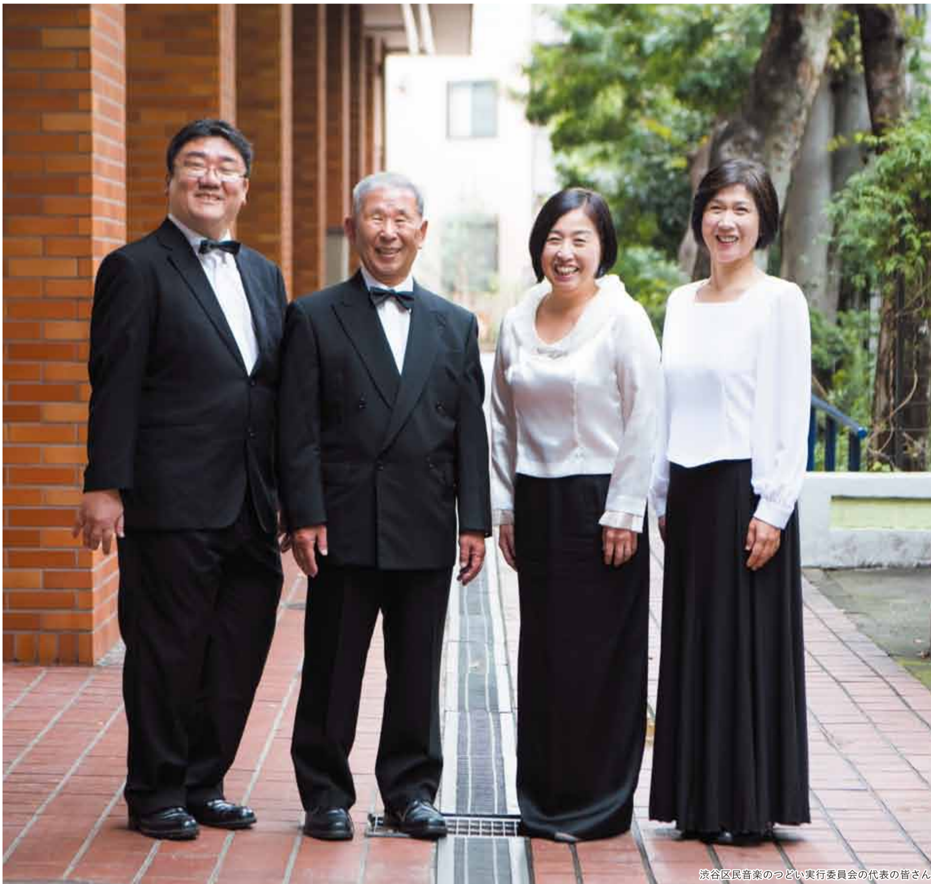
渋谷区民音楽のつどい実行委員会の代表の皆さん

発行 | 渋谷区 編集 | 広報コミュニケーション課 住所 | 〒150-8010 渋谷1-18-21 電話 | 03-3463-1211 (代表) 公式HP | www.city.shibuya.tokyo.jp/ 公式Twitter | @city_shibuya