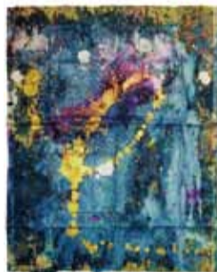
吉増剛造《火ノ刺繍》▶ 2017年 作家蔵