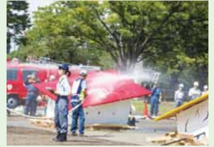
▲渋谷区公式チャンネル(YouTube) 渋谷区総合防災訓練(29年度)