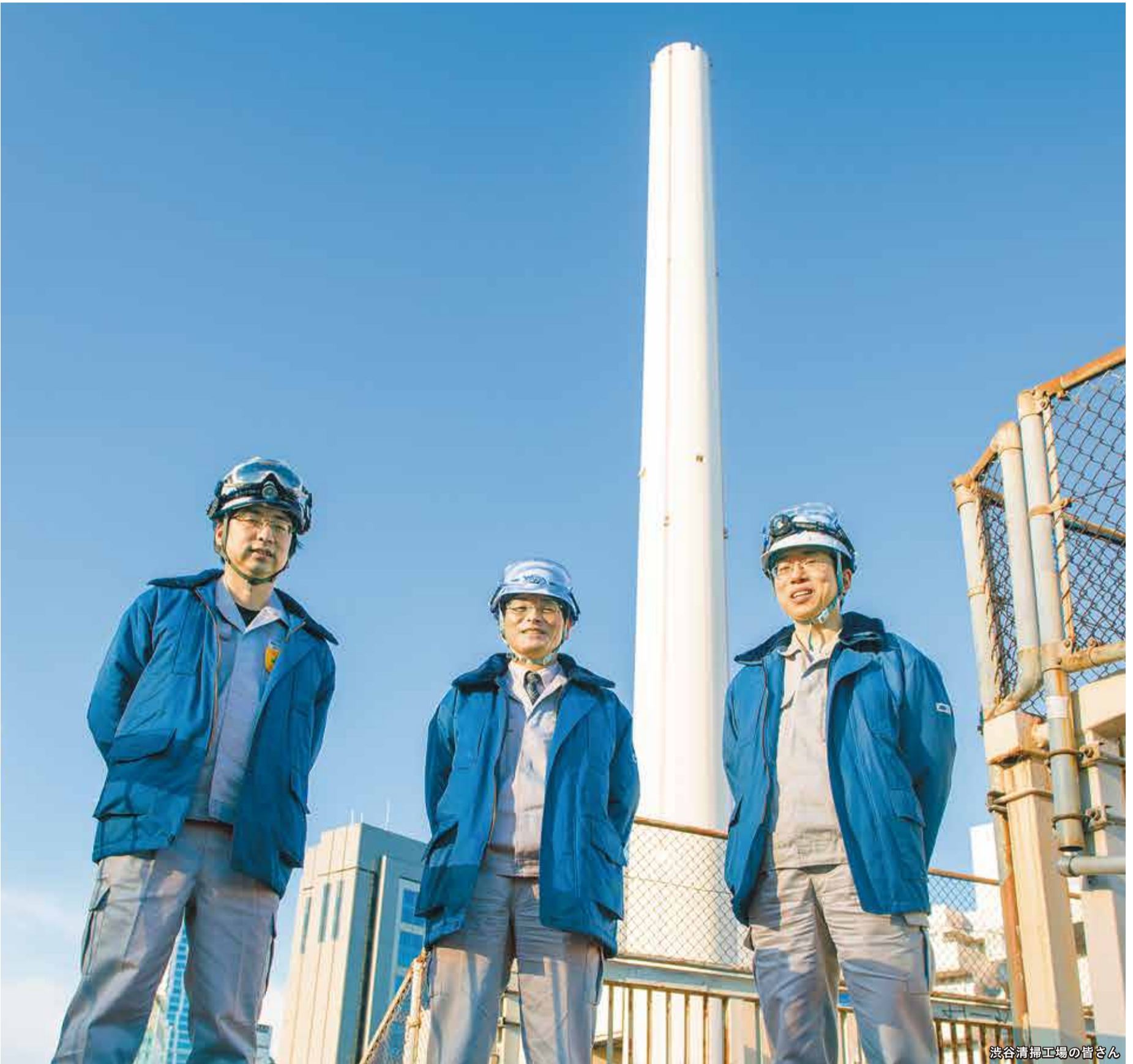
渋谷清掃工場の皆さん

発行 | 渋谷区 編集 | 広報コミュニケーション課 所在地 | 〒150-8010 宇田川町1-1 電話 | 03-3463-1211 (代表) HP | www.city.shibuya.tokyo.jp/ Twitter | @city_shibuya Facebook | @shibuya.city Instagram | @city_shibuya_official LINE | @shibuyacity