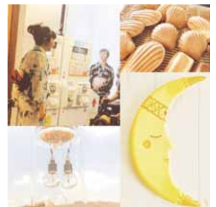
▲7日のみ、七夕をテーマにしたアクセサリーやスイーツなどを販売します

問 コスモプラネタリウム渋谷 (☎3464-2131 FAX3464-2148)