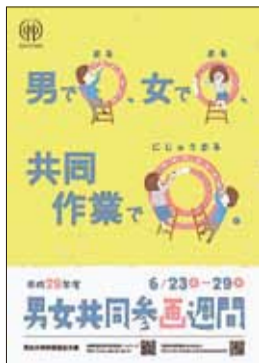
▲内閣府実施の29年度 キャッチフレーズ最優秀作品 土橋義広さん(埼玉県)