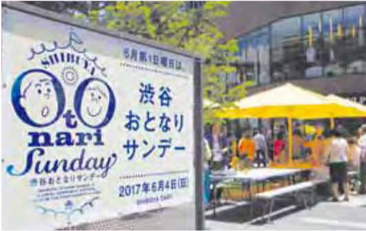
▲渋谷おとなりサンデーキックオフイベントの様子

高齢者の孤独死をきっかけにパリで始まった「隣人祭り」にヒントを得た新たな取り組みですが、コミュニティーの活性化に向け、ダイバーシティ・渋谷らしい、誰もが気軽に参加できるお祭りとして、ぜひ定着してほしいと思います。そのため、今後も専用ホームページの充実や地域人材の発掘・育成などの支援をしてまいります。