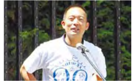
▲渋谷おとなりサンデー(渋谷キャスト)にて

そこで、多様化する区民ニーズに柔軟かつ迅速に対応するとともに、施設を最大限に活用し、効率的で効果的なサービスが提供できるように「指定管理者制度」を導