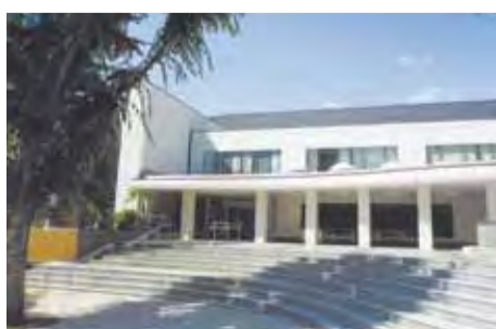
▲スポーツセンター

(2) ICT教育については、区立小中学校全児童・生徒に1人1台のタブレットを配布し、持ち帰り学習を可能にします。新たな校務支援システムの導入により教員の校務負担を軽減し、教員が子どもたちに向き合う時間を確保するなど、質の高い教育を実現するため、準備を進めています。