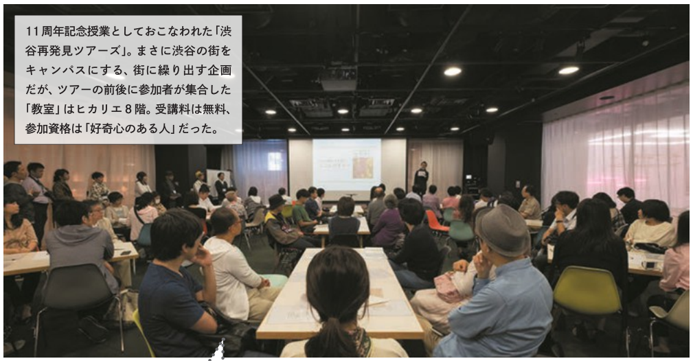
11周年記念授業としておこなわれた「渋谷再発見ツアーズ」。まさに渋谷の街をキャンパスにする、街に繰り出す企画だが、ツアーの前後に参加者が集合した「教室」はヒカリエ8階。受講料は無料、参加資格は「好奇心のある人」だった。