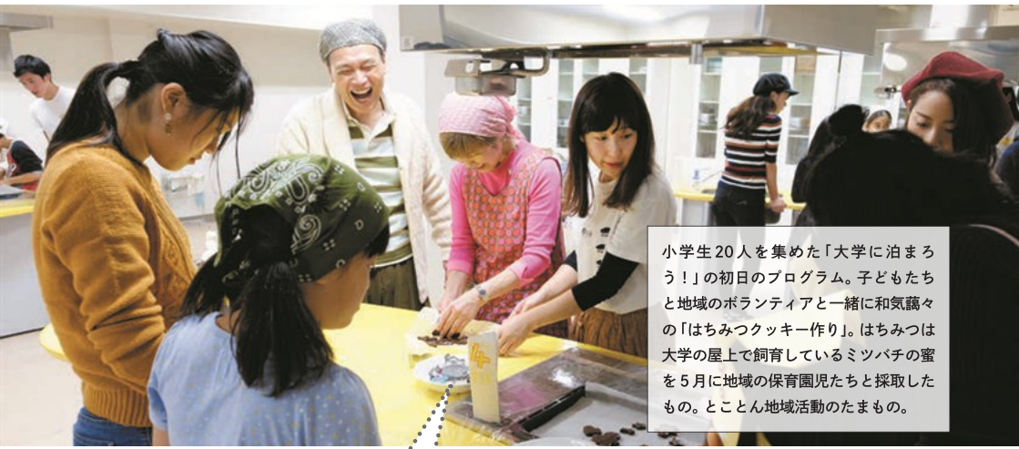
小学生20人を集めた「大学に泊まろう！」の初日のプログラム。子どもたちと地域のボランティアと一緒に和気藹々の「はちみつクッキー作り」。はちみつは大学の屋上で飼育しているミツバチの蜜を5月に地域の保育園児たちと採取したもの。とことん地域活動のたまもの。