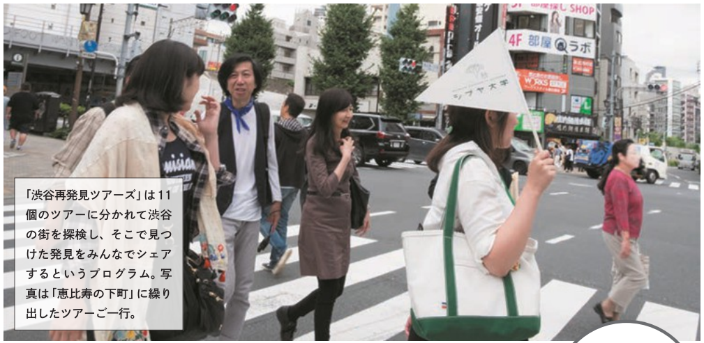
「渋谷再発見ツアーズ」は11個のツアーに分かれて渋谷の街を探検し、そこで見つけた発見をみんなでシェアするというプログラム。写真は「恵比寿の下町」に繰り出したツアーご一行。

本日 NPO ができて今年で 20 年。一九九八年に特定非営利活動促進法が施行され、利益を目的としない活動に法人として取り組む NPO が地域社会をリードする時代になりました。現在東京だけでも一万近い NPO 法人が認証されていますが、地域カッパ―未経験者にとってはまだまだ身近な存在ではないでしょう。そこで、渋谷で活動するとしても敷居の低い NPO を二つご紹介します。 一つ目は、授業を受けることが NPO 活動に参加することになるシブヤ大学。大学と名乗るものの、入試もなければ、誰にでも門戸を開く NPO の新しい学び舎です。