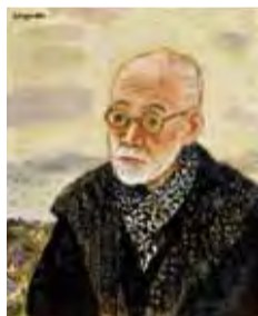
《斎藤茂吉肖像画》鈴木信太郎画、1952(昭和27)年、油彩、斎藤茂吉記念館所蔵