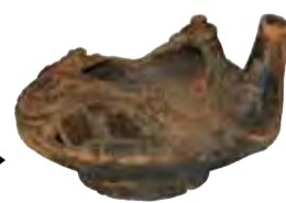
縄文時代の渋谷土器 ▶ (豊沢貝塚出土)