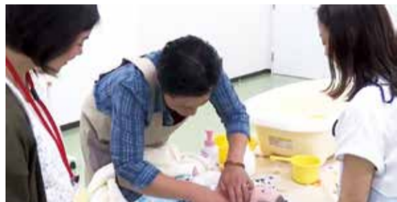
場恵比寿保健相談所 (☎3443-6251 ㊟3443-6253)

回5月18日(土)9:30～11:30または13:30～15:30 場恵比寿社会教育館 内容講演、沐浴実習、妊婦体験など 講師助産師 対象在住で第1子を妊娠している人(16～35週)とパートナー ※既受講者を除く 定各20組(先着) 申4月23日から電話で