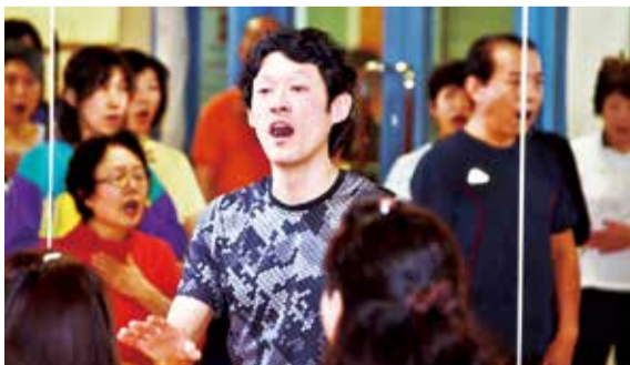
会場 幡ヶ谷社会教育館 (☎3376-1541 ☎3375-9278)