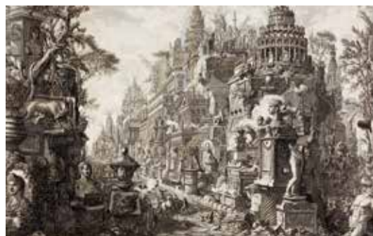
▲ジョヴァンニ・パティスタ・ピラネージ『ローマの古代遺跡』(第2巻II)より:古代アッピア街道とアルデアティーナ街道の交差点 1756年刊 町田市立国際版画美術館