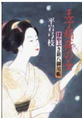
▲『はやぶさ新八御用帳王子稲荷の女』