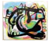
▲動くかたちを楽しもう