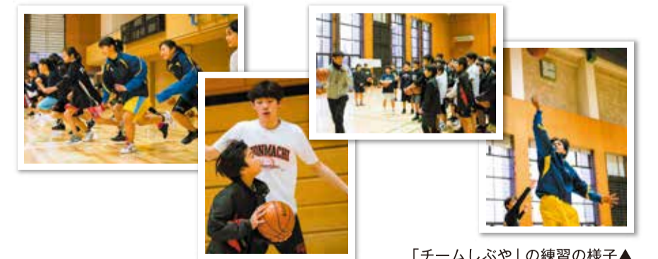
「チームしぶや」の練習の様子▲

▶ チームしぶやの皆さんへのインタビューは4月2・9日に「渋谷の星」で放送します。