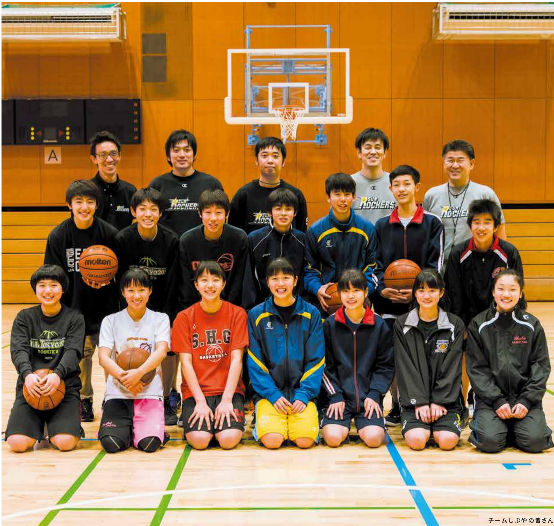
チームしぶやの皆さん

発行 | 渋谷区 編集 | 広報コミュニケーション課 所在地 | 〒150-8010 宇田川町1-1 電話 | 03-3463-1211 (代表) HP | www.city.shibuya.tokyo.jp/ Twitter | @city_shibuya Facebook | @shibuya.city Instagram | city_shibuya_official