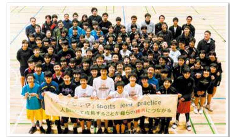
▲「チームしぶや」の練習に参加した皆さん