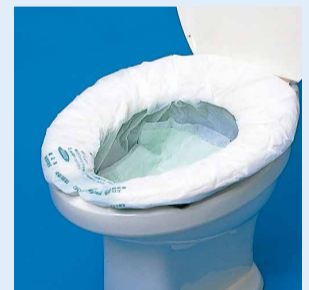
(写真は区のアっせん用品)

(例)トイレ用便袋(サニタクリーン)高速吸水凝固シート付、20枚、2,400円(税別・送料込み)