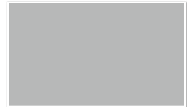
ISUジュニアグランプリカナダ大会2018表彰式の様子 ▲ (著作権の都合によりHPには不掲載)