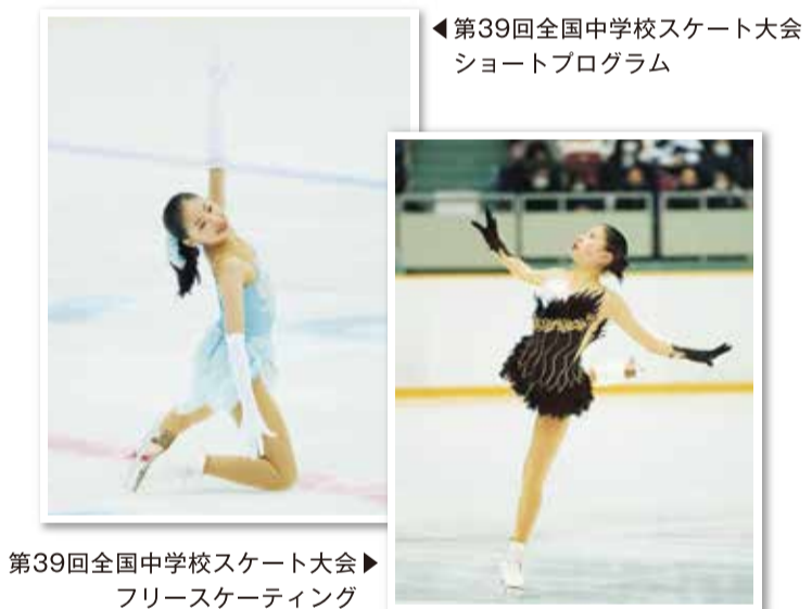
第39回全国中学校スケート大会 ▶ フリースケーティング

2003年8月15日生まれ。 区立原宿外苑中学校卒業。 3歳からフィギュアスケートを始める。 2016年 全日本ノービス選手権大会で史上最高得点を記録し優勝。 2018年9月 ISUジュニアグランプリカナダ大会で銅メダルを獲得。