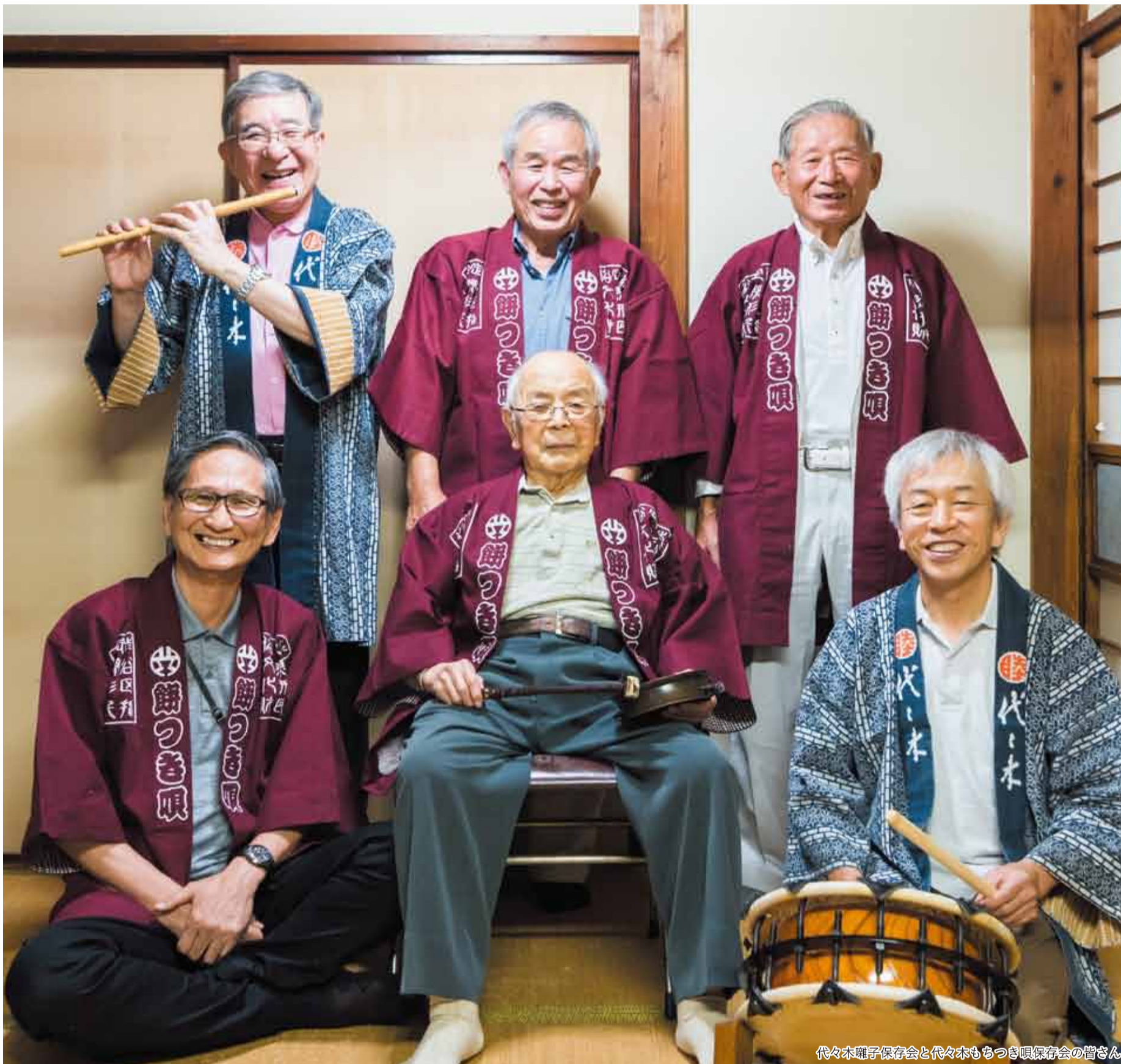
代々木囃子保存会と代々木もちつき唄保存会の皆さん

発行 | 渋谷区 編集 | 広報コミュニケーション課 住所 | 〒150-8010 渋谷1-18-21 電話 | 03-3463-1211 (代表) 公式HP | www.city.shibuya.tokyo.jp/ 公式Twitter | @city_shibuya