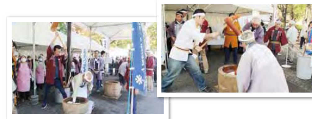
※代々木囃子保存会と代々木もちつき唄保存会の皆さんのインタビューは、10月17・24・31日「渋谷隣人祭り」で放送予定。

※くみんの広場の詳細は、10月15日発行の渋谷区くみんの広場 ふるさと渋谷フェスティバル2017特集号をご覧ください。