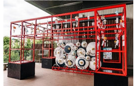
「くらげと傘と風鈴と」

クラゲエリア「クラゲワンダー」に展示しているクラゲを中心に、25種類のクラゲをモチーフに制作した「クラゲ風鈴」を展示します。風鈴は、当館の飼育スタッフ監修のもと、ガラス専門店「TAKU GLASS」が制作しました。飼育スタッフならではの視点で色や形、触手の長さなど、種類ごとに異なる繊細な特徴を再現しています。今年は、新たに世界最大級のクラゲとしてギネス世界記録に認定されているキタユウレイクラゲの風鈴が登場します。