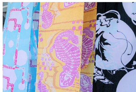
ゆるる海の染色のれん

京都市立芸術大学染織専攻の2年生、14名が手掛ける「ゆるる海の染色のれん」を初展示します。のれんの制作は4月にスタートし、クラゲや多様な魚など、京都水族館のさまざまないきものスケッチを行い、染色のれんにデザインしています。のれんは、「京の里山」エリアの東屋とせせらぎデッキに飾り、癒やしの空間をお楽しみいただけます。