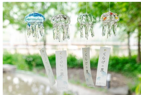
毎年人気のクラゲ風鈴 (左からあさぎ色、クリア、新緑、夏みかん)

「TAKU GLASS」で一つ一つ丁寧に作られた風鈴は、見た目も音色も美しく夏の涼にぴったりです。クラゲ風鈴を飾り、ご自宅でも京都水族館気分をお楽しみください。