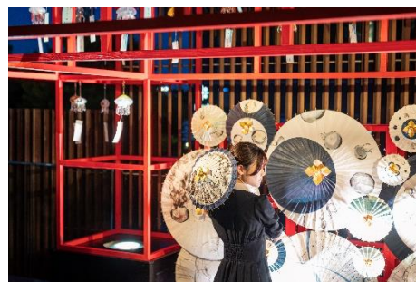
夕方以降の演出で思い出の一枚を

さらに、午後6時以降には2階テラスの風鈴と京和傘、スロープ1階エリアの風鈴をライトアップします。「京の里山」エリアを眺めながら、夜ならではの幻想的な雰囲気もお楽しみください。