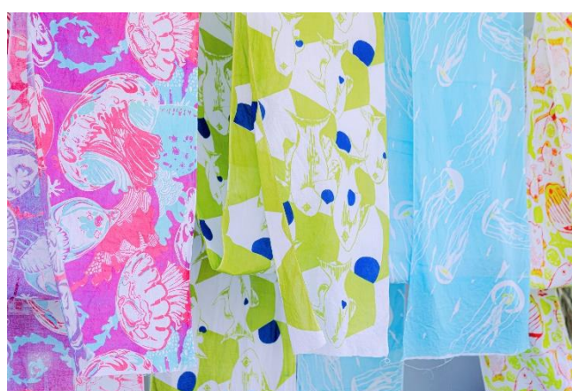
ゆるる海の染色のれん（イメージ）

本イベントは、多種多様なクラゲの魅力をお届けする期間限定イベントです。京都水族館で飼育するクラゲを再現したクラゲ風鈴とクラゲ京和傘を飾り、涼やかな空間を演出します。今年は、世界最大級のクラゲとしてギネス世界記録に認定されているキタユウレイクラゲの風鈴が新たに登場し、全 25 種類、約 170 個の風鈴を展示します。