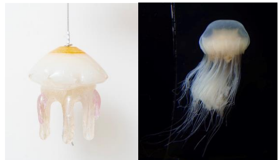
キタユウレイクラゲ

キタユウレイクラゲは、傘の大きさが40～70cmまで大きくなる大型クラゲで、世界最大級のクラゲとしてギネス世界記録に認定されています。英名は「lion's mane jellyfish」といい、ライオンのたてがみの異名を持ちます。しなやかな触手を携え、力強く拍動する姿はまさしくライオンのたてがみのように見えます。2階「クラゲワンダー」の京都クラゲ研究部にて展示中です。新登場のキタユウレイクラゲの風鈴を見た後は、本物の観察もぜひお楽しみください。