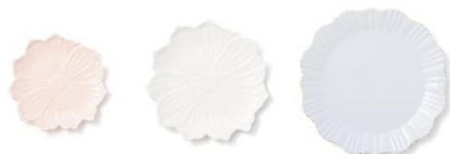
【商品名】ペタルフリルプレート S・M・L 【種類】ピンク/ホワイト/ブルー/イエロー 【価格】S:各 1,200 円 M:各 1,600 円 L:各 2,000 円