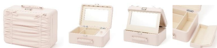
【商品名】リボン コスメボックス 【価格】9,000 円

観音開き仕様の新型ジュエリーボックスです。内側にはスエード調の生地をあしらい、大切なアクセサリをやさしく包み込みながら美しく保護します。大容量で、大ぶりのリングやピアス、サングラスまで美しく収納できます。