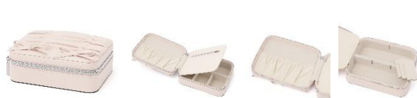
【商品名】リボン トラベルジュエリーボックス マルチ 【価格】3,900 円

コンパクトながら収納力のある、持ち運び用ジュエリーボックスです。内側にはスエード調の生地をあしらい、大切なアクセサリをやさしく包み込みながら美しく保護します。旅行や外出先でのアクセサリチェンジにも重宝します。