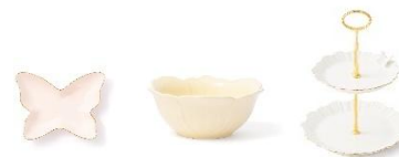
【商品名】ペタルフリルバタフライプレート・ボウル 【種類】ピンク/ホワイト/ブルー/イエロー 【価格】バタフライプレート:各 800 円 ボウル:各 1,000 円 【商品名】ペタルフリル 2 段 ケーキスタンド 【種類】ピンク/ホワイト 【価格】各 2,800 円

花をモチーフにしたプレートやカップ&ソーサー、ティーポット、マグ、ケーキスタンドまで揃う、可憐なテーブルウェアコレクションです。ワントーン配色でまとめているためコーディネートしやすく、ライン使いで揃えることで、より華やかで統一感のあるティータイムを演出します。花びらのようなスカルップデザインや、蝶をあしらったディテールが、食卓に軽やかなアクセントを添えます。