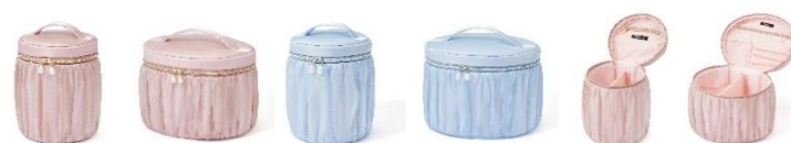
【商品名】オーガンジーフラワー バニティポーチ S・L 【種類】ピンク/ライトブルー 【価格】S:各 3,500 円・L:各 4,500 円