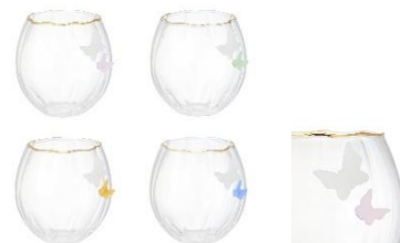
【商品名】バタフライ タンブラー 【種類】ピンク/イエロー/グリーン/ブルー 【価格】各 1,400 円

お花や蝶の立体モチーフがフォトジェニックなガラスウェアです。ガラスティーシリーズ、セラミックと組み合わせて、お花畑のような華やかで春らしいテーブルコーディネートが楽しめます。