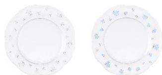
【商品名】フラワーガラスプレート 【種類】ホワイト/ブルー 【価格】各 1,400 円

お花や蝶の立体モチーフがフォトジェニックなガラスウェアです。ガラスティーシリーズ、セラミックと組み合わせて、お花畑のような華やかで春らしいテーブルコーディネートが楽しめます。