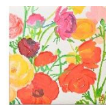
【商品名】BRIDGETTE アートボード 【種類】チューリップ/ラナンキュラス 【価格】チューリップ:4,000 円 ラナンキュラス:3,500 円

カナダ・モントリオールで育った抽象画家「クレア」のアート作品です。グラフィックデザイナーとしての経験を経て生み出された作品は、世界中の個人・企業コレクションに收藏されています。色彩鮮やかなフラワーモチーフで、春の華やかなコーディネートに相応しい1枚です。