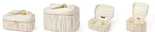
【商品名】パールブロッサム バニティポーチ S・L 【価格】S:3,500 円・L:4,500 円

お花のつぼみをイメージした、繊細でエレガントな印象のポーチシリーズです。コンパクトな S サイズから大容量のバニティタイプの L サイズまで展開し、ライフスタイルに合わせて選べる仕様。内側にはポケットや取り外し可能な仕切りを備え、機能性にも優れています。バニティポーチは持ち手にあしらった大粒のゴールドビーズがアクセントとなり、上品さの中にさりげない個性をプラスします。