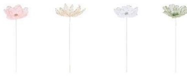
【商品名】アートフラワー チュール フLOWER・リーフ 【種類】フLOWER: ピンク/ライトイエロー/ホワイト/グリーン リーフ: ホワイト/グリーン 【価格】フLOWER: 各 900 円・リーフ: 各 700 円