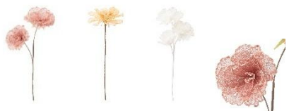
【商品名】アートプランツ メッシュ フLOWER 【種類】ピンク/イエロー/ホワイト 【価格】各 1,200 円

パールとレースをあしらった、キュートな蝶々モチーフのアートプランツです。アートフラワーと一緒に飾れば、花に蝶が集まっているような演出に。春らしい明るいカラーのフラワーとの組み合わせがおすすめです。