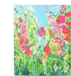
【商品名】CLAIRE アートボード 【種類】フラワーガーデン 【価格】10,000 円