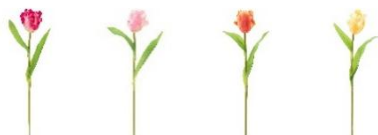
【商品名】アートフラワー フリルチュールリップ 【種類】ダークピンク/ピンク/オレンジイエロー 【価格】各 600 円