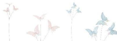
【商品名】アートプランツ バタフライ 【種類】ライトピンク/ライトブルー 【価格】各 1,500 円

フリルが特徴的なチュールリップモチーフのアートフラワーです。生花のような美しい色合いですが、お手入れ不要で長く美しい状態を楽しめます。茎に動きをつけることで、よりトレンド感のあるアレンジが可能です。