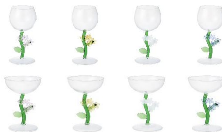
【商品名】フลาวーステム ワイングラス・デザートグラス 【種類】ピンク/イエロー/ホワイト/ブルー 【価格】各 1,800 円