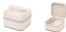
【商品名】リボン トラベルジュエリーボックス S 【価格】2,400 円

チャーム付きで持ち運べる、ミニサイズのジュエリーボックスです。内側にはスエード調の生地をあしらい、大切なアクセサリをやさしく包み込みながら美しく保護します。バッグに取り付けられるため、旅行やジム、仕事中等、外出先で一時的にジュエリーを外すシーンにもスマートに対応できます。