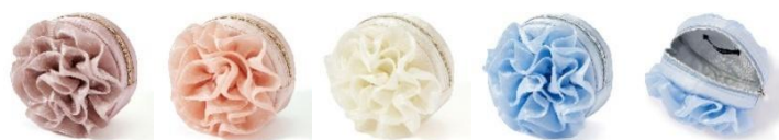
【商品名】オーガンジーフラワー ミニポーチ 【種類】ピンク/オレンジ/アイボリー/ライトブルー 【価格】各 2,200 円