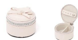
【商品名】リボン ミニトラベルジュエリーボックス 【価格】1,500 円

チャーム付きで持ち運べる、ミニサイズのジュエリーボックスです。内側にはスエード調の生地をあしらい、大切なアクセサリをやさしく包み込みながら美しく保護します。バッグに取り付けられるため、旅行やジム、仕事中等、外出先で一時的にジュエリーを外すシーンにもスマートに対応できます。