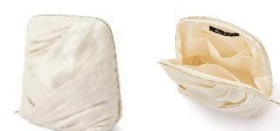
【商品名】パールブロッサム スタンドポーチ 【価格】2,900 円