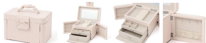
【商品名】リボン ジュエリーボックス 【価格】7,900 円

眼鏡やサングラスも収まるサイズ設計のジュエリーケースです。仕切りは可動式なので、アクセサリはもちろん、コンタクトケースやヘア小物、香水瓶など形の異なるアイテムも美しく整理できます。ポケット部分にはパスポートやチケットを収納でき、旅先で必要なものをひとつにまとめられるのも魅力。折れにくい素材を使用したファスナー付きポーチは、旅先で手に入れた大切なアイテムやアクリルスタンドなどの持ち運びにも活躍します。