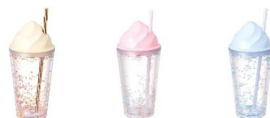
【商品名】アイス プラスチックタンブラー 【種類】ホワイト/ピンク/ブルー 【価格】各 1,200 円