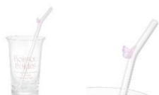
【商品名】タイポ ストロー付きガラスタンブラー 【種類】ピンク 【価格】1,800 円