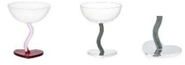
【商品名】ハートデザートグラス 【種類】レッド/シルバー 【価格】各 1,600 円

ハートモチーフのウィンググラスとデザートグラスです。カラフルなハート型の台座と、うねうねとしたステムのデザインが特徴。トレンド感のある新色のシルバーが登場し、既存のレッドと組み合わせてテーブルコーディネートをお楽しみいただけます。ウィンググラスにはカクテルやシャンパン、デザートグラスには甘いスイーツを入れて、ディナータイムや女子会でも活躍するアイテムです。