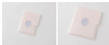
【商品名】ギフトバッグ SS/S 【価格】各 20 円