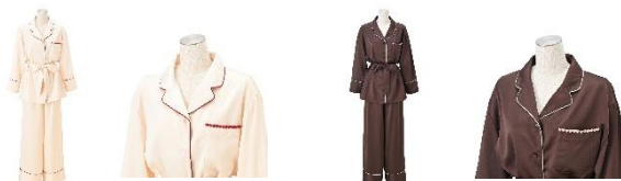
【商品名】ヒアルロン酸加工 ハートラインサテンパジャマ 【種類】アイボリー/ブラウン 【価格】各 6,500 円

大きめのハート型ボタンがポイントのカーディガンです。柔らかなモールニット素材で、冬から春にかけての温度調節に最適。バレンタインを連想させるカラーリングで、「ヒアルロン酸加工 ハートラインサテンパジャマ」とのコーディネートを楽しめます。