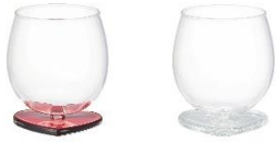
【商品名】ハートフットタンブラー 【種類】レッド/シルバー 【価格】各 1,400 円

台座がハート型の、かわいいフォルムのタンブラーです。日常で使用頻度の高いタンブラー形状を、遊び心あるデザインに仕上げました。ハート型の台座がテーブルに置くだけで楽しい雰囲気演出し、見た目でも楽しめます。