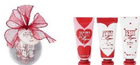
【商品名】26SS プチミニョン ハンドクリームセット 【種類】レッド 【価格】1,000 円

オーナメントのようなハート型クリア容器に入った、ネイルオイルとハンドクリームのハンドケアセットです。ネイルオイルはお花入りで、見た目も華やか。ハンドクリームはラズベリーの香りで、ネイルオイルはバレンタインらしいスウィートチョコレートの香りを楽しめます。