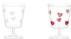
【商品名】ドットハートゴブレット 【種類】ホワイト/レッド 【価格】各 1,800 円