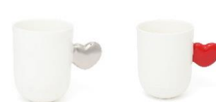
【商品名】ハート ハンドル マグ 【種類】シルバー/レッド 【価格】各 1,500 円

取っ手がぷっくりとしたハート型のマグです。トレンド感のあるシルバーを取り入れたカラーバリエーションで、エンボス加工のロゴをあしらひ、かわいらしい印象に上げています。