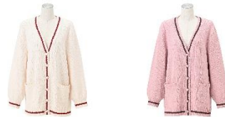
【商品名】ハートボタン ラインカーディガン 【種類】アイボリー/ピンク 【価格】各 5,800 円

大きめのハート型ボタンがポイントのカーディガンです。柔らかなモールニット素材で、冬から春にかけての温度調節に最適。バレンタインを連想させるカラーリングで、「ヒアルロン酸加工 ハートラインサテンパジャマ」とのコーディネートを楽しめます。