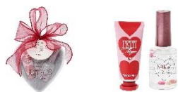
【商品名】26SS プチミニョン ネイルケアセット 【種類】レッド 【価格】1,000 円

オーナメントのようなハート型クリア容器に入った、ネイルオイルとハンドクリームのハンドケアセットです。ネイルオイルはお花入りで、見た目も華やか。ハンドクリームはラズベリーの香りで、ネイルオイルはバレンタインらしいスウィートチョコレートの香りを楽しめます。