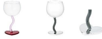
【商品名】ハートウィンググラス 【種類】レッド/シルバー 【価格】各 1,600 円

台座がハート型の、かわいいフォルムのタンブラーです。日常で使用頻度の高いタンブラー形状を、遊び心あるデザインに仕上げました。ハート型の台座がテーブルに置くだけで楽しい雰囲気演出し、見た目でも楽しめます。