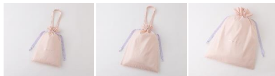
【商品名】巾着ギフトバッグ S・M・L 【価格】各 220 円