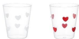
【商品名】ドットハートタンブラー 【種類】ホワイト/レッド 【価格】各 1,600 円

取っ手がぷっくりとしたハート型のマグです。トレンド感のあるシルバーを取り入れたカラーバリエーションで、エンボス加工のロゴをあしらひ、かわいらしい印象に上げています。