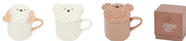
【商品名】ホイップマグ 【種類】キャラメル/ミルク/チョコレート 【価格】各 2,000 円

ホイップクリームで作ったような動物の顔をした、蓋付きのマグです。たれ耳の犬はキャラメル味、白い犬はミルク味、くまはチョコレート味をイメージ。ちょっと一息つきたいティータイムに、ホイップのようなやすらぎの時間をお楽しみください。パッケージはギフトにもふさわしいデザインに仕上げていますので、贈り物にも最適です。