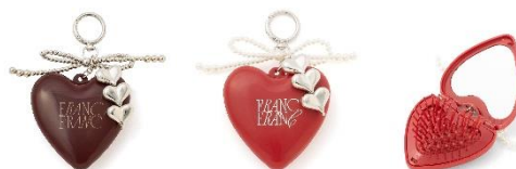
【商品名】チャーム付き ミラー&ブラシ 【種類】ブラウン/レッド 【価格】各 1,600 円

キャッチーなハートモチーフがかわいい、バレンタイン限定カラーのチャーム付きミラー&ブラシです。甘くなりすぎないよう、トレンド感のあるロゴやチャームをあしらひ、大人かわいい雰囲気仕に仕上げました。カラビナ付きでチャームとしてバッグに付けられるだけでなく、開くとミラーとブラシがセットされているので、外出先でメイク直しやヘアセットに便利です。