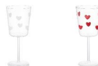
【商品名】ドットハートワイングラス 【種類】ホワイト/レッド 【価格】各 1,800 円

ハートがドットのようにちりばめられたデザインのグラスです。シンプルな形状のタンブラーから、ハートゴブレットやワイングラスまでラインアップ。組み合わせればより華やかな印象になり、バレンタインパーティーや特別なシーンにぴったりのグラスシリーズです。