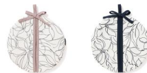
【商品名】リーニュ ポットホルダー 【種類】ピンク/ブルー 【価格】各 1,500 円

花柄を取り入れたエプロン、ミトン、ポットホルダーです。モノクロの線画調で甘すぎないようにしつつ、トレンド感のあるデザインに仕上げました。毎日の料理時間をお洒落に楽しめるアイテムで、3点のデザインを揃えているので、セットで贈るギフトとしてもおすすめです。ポリエステル素材のため洗濯後も乾きやすく、エプロンはシワになりにくいため日常使いにも最適です。