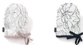
【商品名】リーニュ ミトン 【種類】ピンク/ブルー 【価格】各 1,800 円