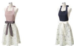
【商品名】リーニュ フルエプロン 【種類】ピンク/ブルー 【価格】各 4,580 円