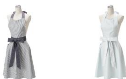
【商品名】レースリボン フルエプロン 【種類】ブラック/ブルー 【価格】各 4,580 円

ストライプとレースデザインが特徴のエプロンです。ストライプでブラウスのようなカジュアル感を出しつつ、腰ひものレースで甘さをプラスしています。幅広い世代の方にも着ていただけるように仕上げました。2カラー展開で、自分用にもギフト用にも、好きなテイストをお選びいただけます。ポリエステル素材でシワになりにくく、乾きやすいので日常使いにも最適です。