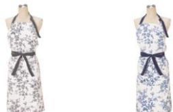
【商品名】ボタニカル コットン フルエプロン 【種類】グレー/ブルー 【価格】各 2,980 円

胸元と裾に、軽やかなメロー仕上げのフリルをあしらったエプロンです。トレンド感のあるドット柄がポイント。