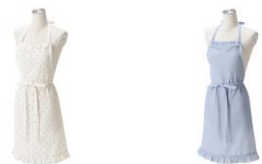
【商品名】ドットフリル フルエプロン 【種類】アイボリー/ブルー 【価格】各 2,980 円

胸元と裾に、軽やかなメロー仕上げのフリルをあしらったエプロンです。トレンド感のあるドット柄がポイント。