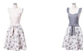
【商品名】リリア フルエプロン 【種類】ベージュ/グレー 【価格】各 5,480 円

落ち着いた色合いの花柄のエプロンです。コットンのさらっとした肌触りが心地よく、白い生地にかすんだブルーの植物柄が映えます。