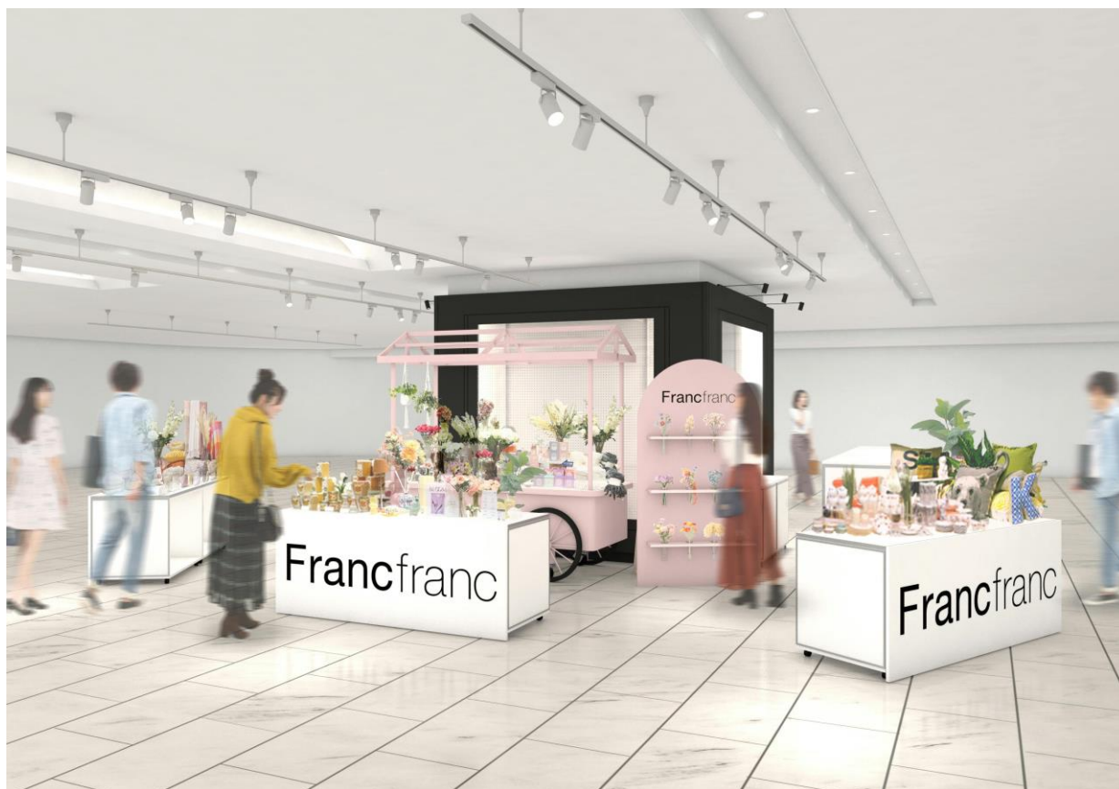
<POP UP SHOP イメージ>

会場には、Francfranc 初となるオリジナルのアートフラワーワゴン『Francfranc Bloom Bar』が登場。ここでしか出会えない、バルーンラッピングを施したブーケも数量限定で展開します。また、2026年4月中旬に発売したばかりの、素敵な“自分時間”を贈る新作ギフトセットをはじめ、母の日におすすめのアイテムをご用意しました。アートフラワーに囲まれた特別な空間で、大切な方へのギフト選びをお楽しみいただけます。