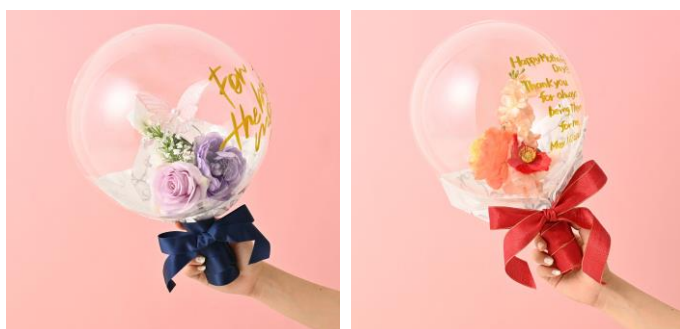
<バルーンラッピングイメージ>

2026年5月1日（金）～2026年5月7日（木）の期間中、母の日に合わせて、1日数量限定でポポバルーンを使用したラッピングのアートブーケギフトを販売します。アートフラワーならではの長く楽しめる特性を活かした、ここでしか出会えない特別なアイテムです。贈った瞬間の高揚感やサプライズ感を演出し、受け取ったときに思わず笑顔になるような、“気持ちがそのまま伝わる特別な体験”をお届けします。ぜひこの機会に、大切な人が心ときめく華やかなラッピングとともに、花に想いを込めたギフトを贈りませんか。