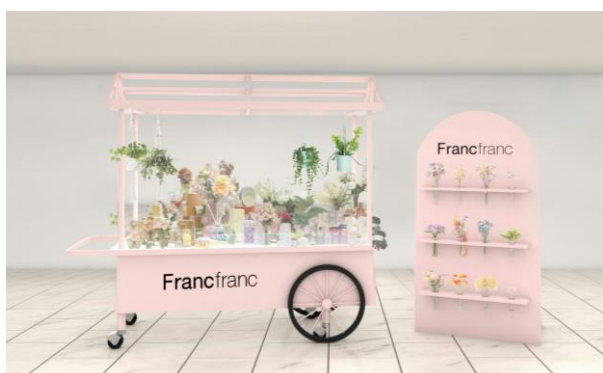
<『Francfranc Bloom Bar』イメージ>