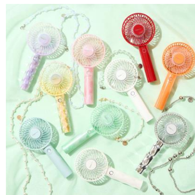
「フレ ハンディファン」シリーズ