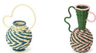
【商品名】バスケット ウェーブ ベース オブジェ 【種類】イエロー/グリーン 【価格】各 2,800円

小物入れとしても使える、カニの形をしたユニークなオブジェです。手作業で編み上げた温かみのある風合いが、空間に夏らしい抜け感をプラス。さりげない遊び心を添えながら、インテリアのアクセントとして活躍します。アクセサリや細かなアイテムの収納に便利で、見せる収納としても楽しめます。