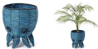
【商品名】オクトバスバスケット (S) 【価格】2,500円

タコのフォルムが目を引く、遊び心溢れるバスケットです。ハンドメイドならではのナチュラルな風合いが夏の空間に心地よくなじみ、置くだけでインテリアのアクセントに。鉢カバーやファブリック収納など、見せる収納としても活躍します。アートグリーンとのコーディネートもおおすすめです。