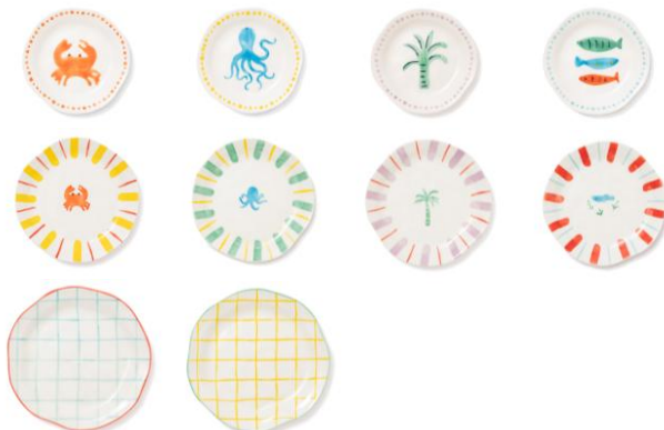
【商品名】ハンドペイントプレート (S/M/L) 【種類】S/M:クラブ/オクトパス/パームツリー/フィッシュ L:チェックブルー/チェックイエロー 【価格】S:各 1,200円 / M:各 1,400円 / L:各 1,800円