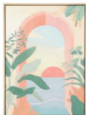
【商品名】リゾートアートボード 【価格】8,000円