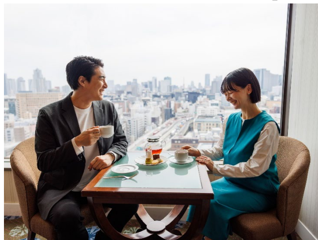
エグゼクティブラウンジ

安産祈願・子授けで有名な「水天宮」近くに位置する当ホテルでは、出産を控えたご夫婦に向けた「マタニティステイプラン」を発売いたします。“新しい命を迎える今しかない大切なひとときを安心してゆっくりとお過ごしいただきたい”との想いから生まれた、出産前の“ラストおふたりステイ”を叶える特別プランです。当プランでは、上質な滞在をお楽しみいただけるエグゼクティブフロアのお部屋をご用意。抱き枕「ハグモッチ プレミアム」などをはじめ妊婦さんの身体に寄り添う備品をご準備し、快適にお過ごしいただける環境を整えております。