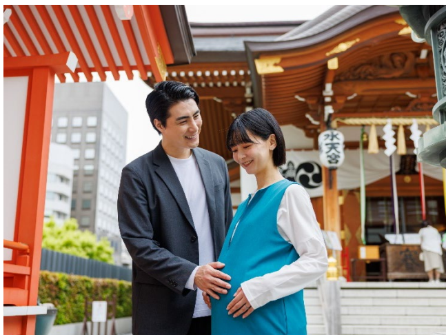
「水天宮」境内 ※特別に許可を得て撮影しております。

■戌の日の安産祈願の記念や妊娠期間のご夫婦の思い出作りに最適な「マタニティステイプラン」が登場