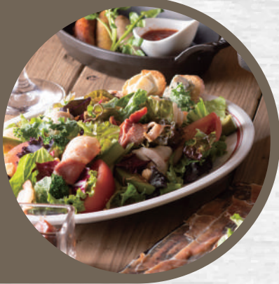
シェフズテラスの定番 コブサラダ