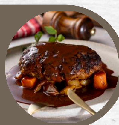
シェフズテラスのハンバーグステーキ