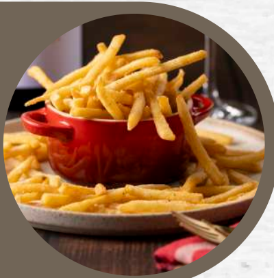
カリカリポテトフライ トリュフソルト風味