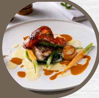
オマールエビと帆立貝 白身魚のポワレ アメリカヌソース