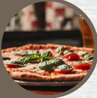
ピッツァ マルゲリータ