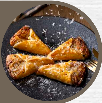
トリュフポテトガレットのパイ包み焼き