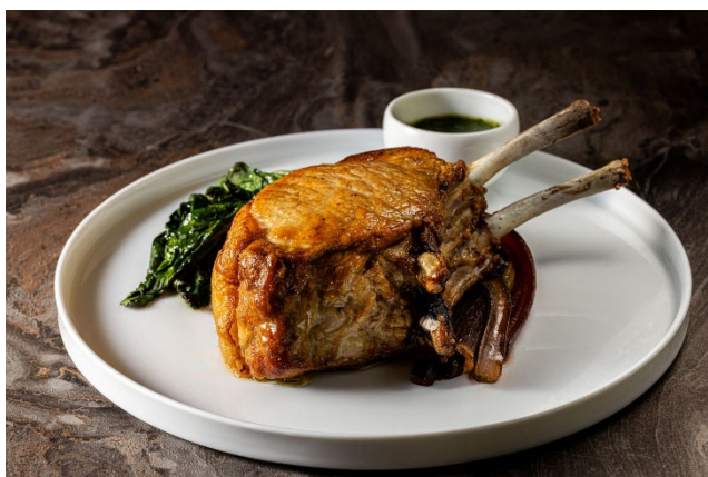
メニュー一例：あぐー豚のトマホーク

また、沖縄のお酒を使ったシグネチャーカクテルをはじめ、彩りも鮮やかなドリンクを多くご用意しております。