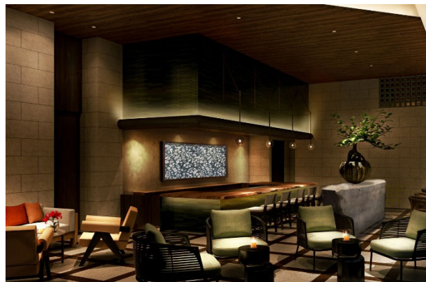
店内イメージ（パース）