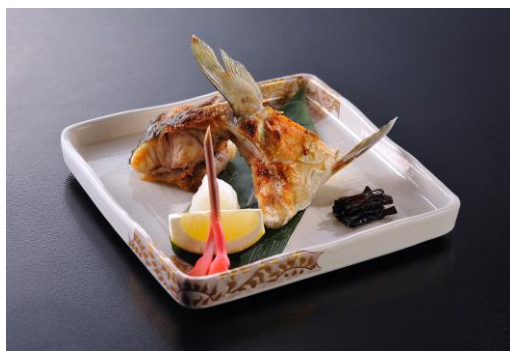
<かんぱちカマ塩焼>