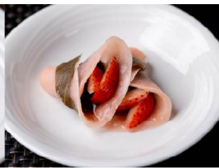
4月：さくらいちご餅