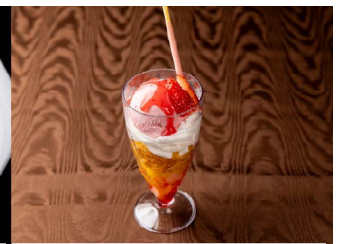
5月：いちごのパフェ