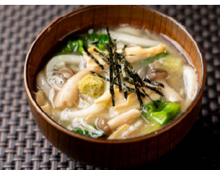
3月：みぞれあんかけうどん