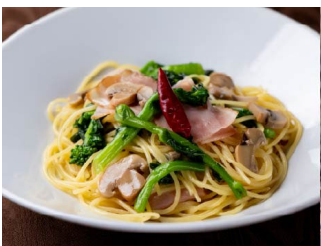
2月：ペペロンチーノ