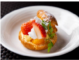
2月：いちごのシュークリーム

フルーツに香ばしいコーンフレーク、とろけるクリームなどおいしさを幾重にも重ねたベースに、ひんやり冷たいストロベリーアスをたっぷりと。仕上げに添えた真っ赤な苺が、心ときめく一品。