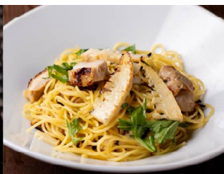
4月：柚子胡椒パスタ