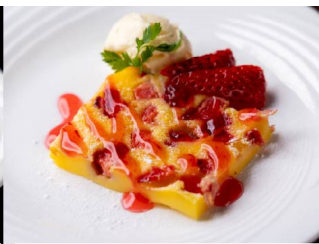
3月：いちごのクラフティ