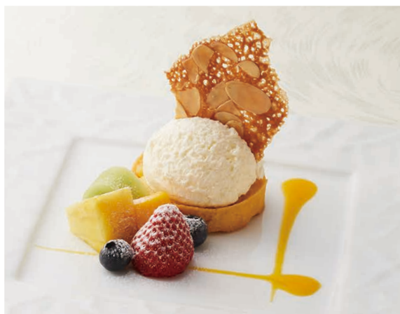
バイクドチーズケーキに クレームダンジュを乗せて 2,000円 Baked cheese cake with "crémet d'Anjou"