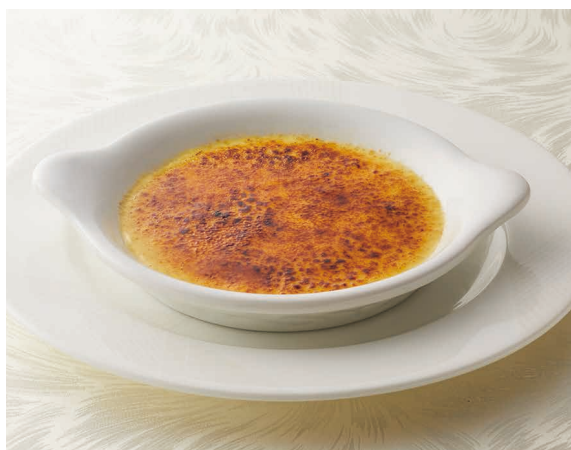
クレームブリュレ 1,800円 Crème Brûlée : scorched custard cream