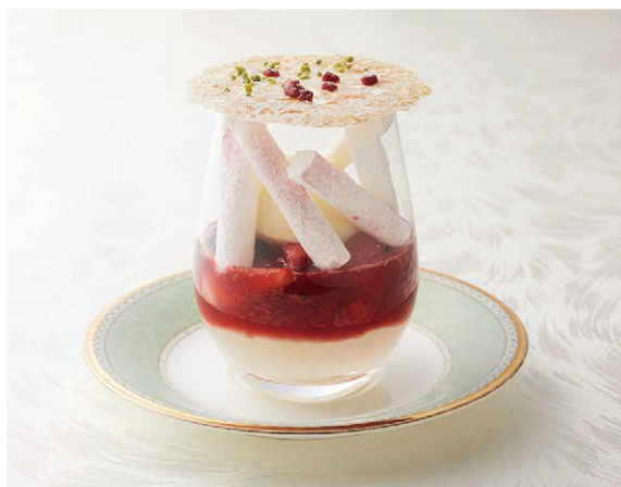
パナコッタと赤いフルーツのコンポート