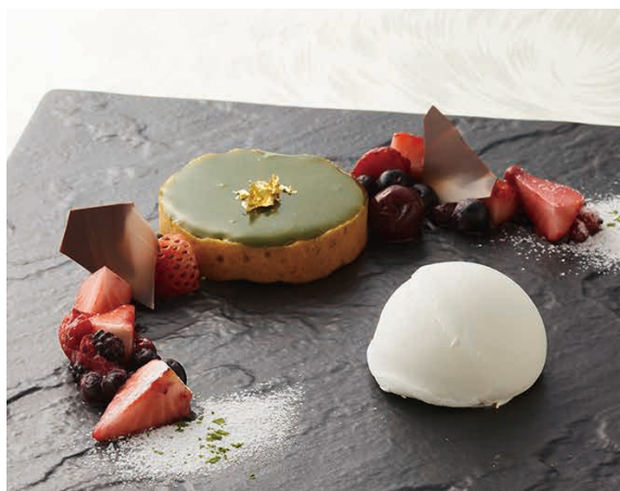
抹茶のタルトショコラ ミルクアイスクリーム添え 2,000円 Green tea chocolate tarte with milk ice cream