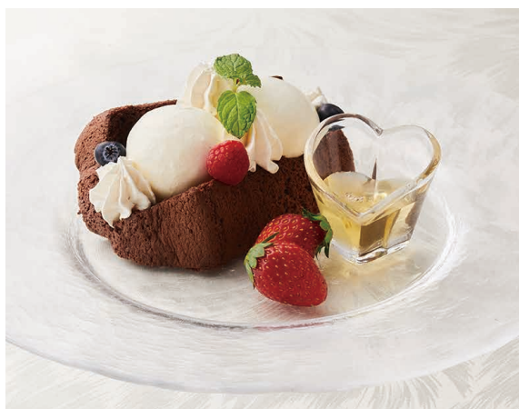
シフォンケーキサンド