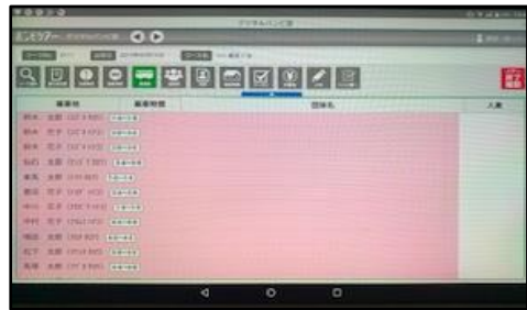
インターネット FAX 機能