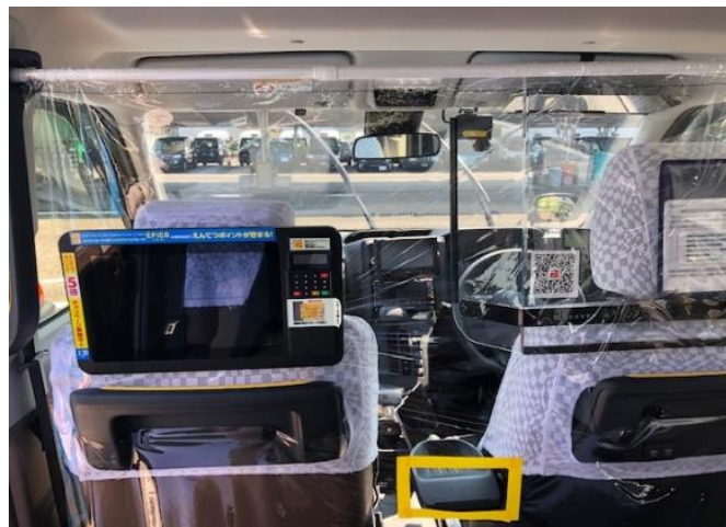
セパレートカーテンを設置した車内の様子